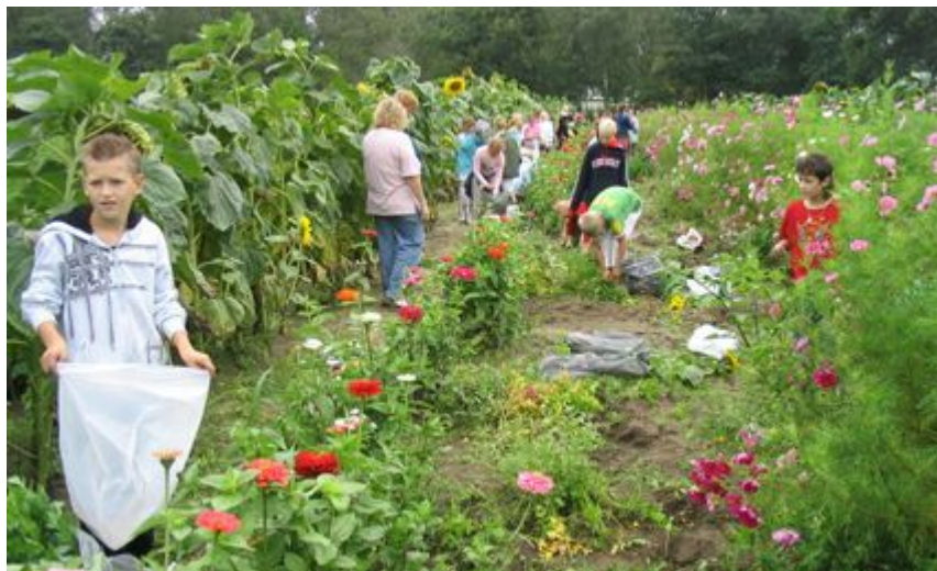
Schooltuintjes – wie de jeugd heeft, heeft de toekomst