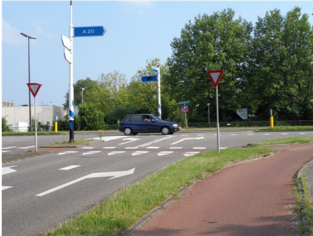
Foto gevaarlijke T-splitsing Deltaweg