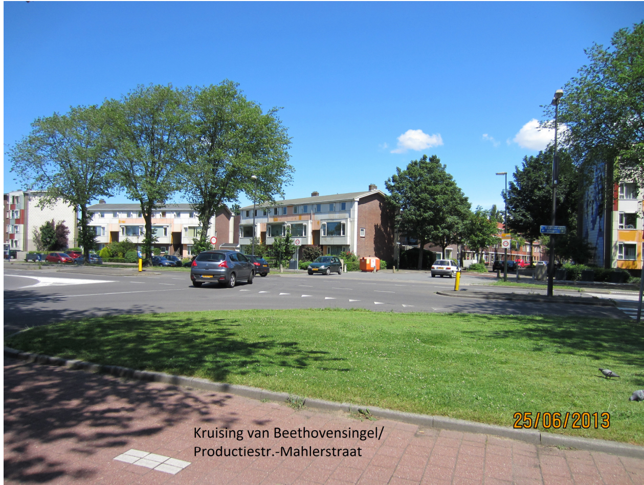
Kruising van Beethovensingel/ Productiestr.-Mahlerstraat